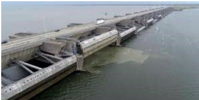
Foto: Haringvlietdam met één schuif open

De resultaten van het Kierbesluit (verzilting westelijk deel van het Haringvliet) qua vismigratie zijn positief te noemen. Er wordt geparticipeerd in de klankbordgroep van Rijkswaterstaat om beperkingen voor de recreatieve watersport te voorkomen. Vooralsnog is dit een succes. De oprukkende zoutgrens (maximaal gesteld op de lijn Middelharnis-monding Spui) vormt wel een punt van aandacht.